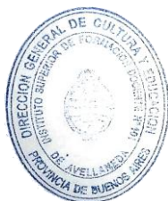
LUCIANO VERDIGLIONE DIRECTOR I.S.F.D. N° 101

NOTA: Es responsabilidad de cada aspirante, previo a la inscripción al concurso, tomar amplio conocimiento de la Resolución N° 6179/25/03 y Plan de Estudio de los Profesorados de Educación Física Resolución 2432/09